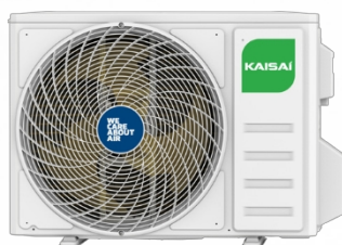
Vonkajšia jednotka KKOH